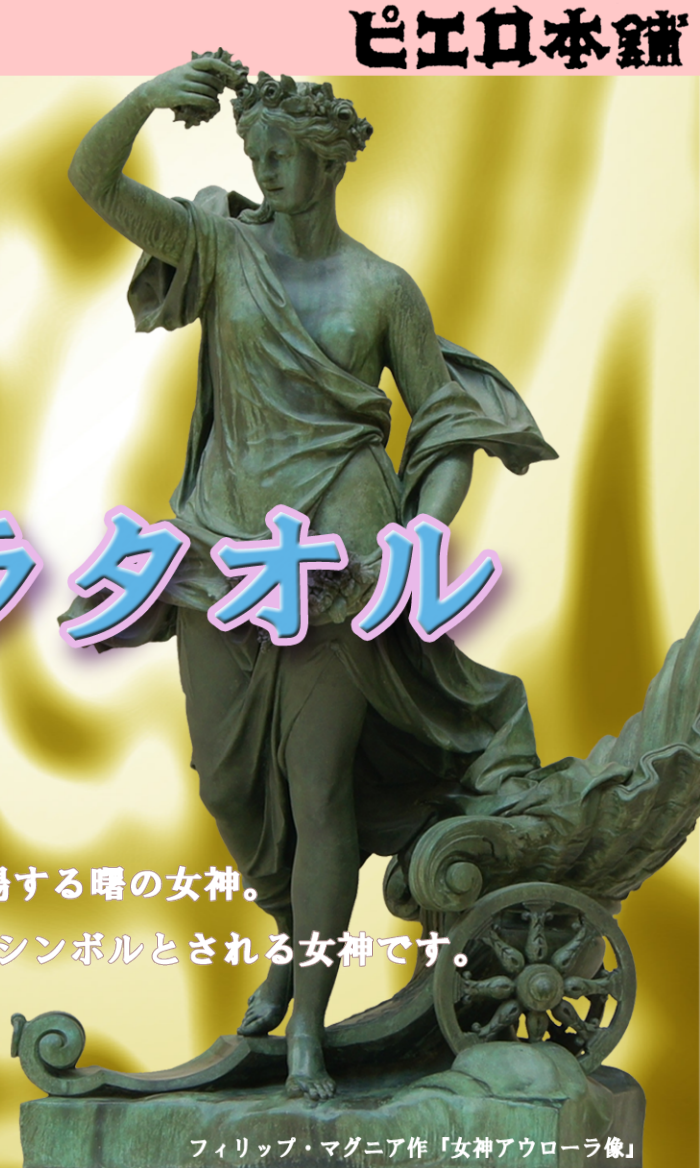
フィリップ・マグニア作「女神アウローラ像」

「アウローラ」は、古代ローマ神話に登場する曙の女神。 知性の光、創造性の光が到達するときのシンボルとされる女神です。