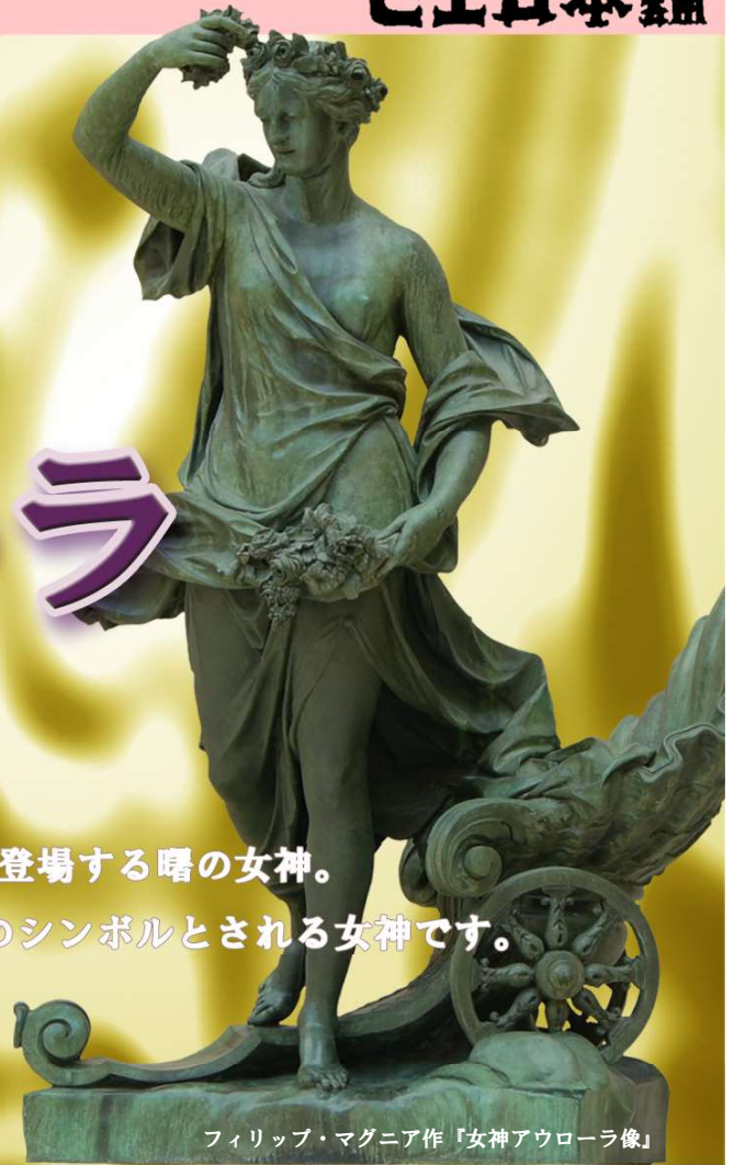
フィリップ・マグニア作「女神アウローラ像」

「アウローラ」は、古代ローマ神話に登場する曙の女神。 知性の光、創造性の光が到達するときのシンボルとされる女神です。