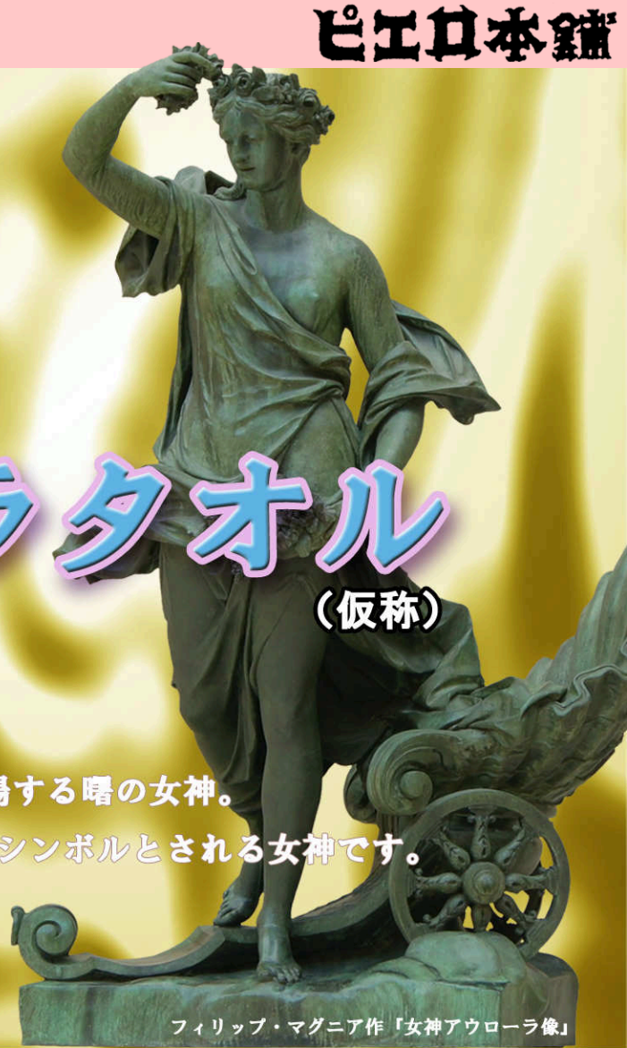
フィリップ・マグニア作「女神アウローラ像」

「アウローラ」は、古代ローマ神話に登場する曙の女神。 知性の光、創造性の光が到達するときのシンボルとされる女神です。